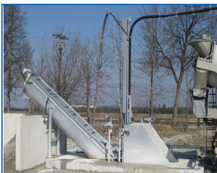
Berger Beton - Werk Unterbrunn