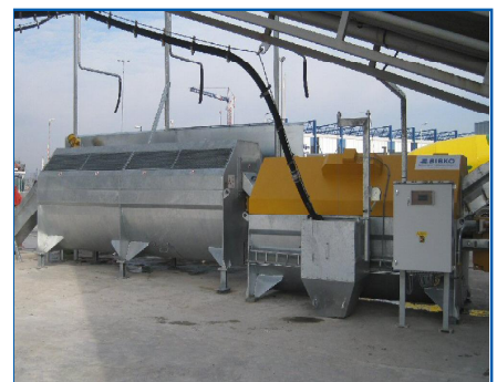
Mebin - Niederlande