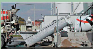
Kompakte Einheit Alle Anlagenteile feuerverzinkt

Fordern Sie ausführliche Unterlagen an! Wir freuen uns auf Sie! www.bibko.com