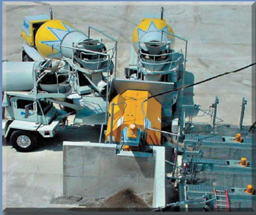
Variable Trichterordnung für 4 Fahrmischer

RESTBETONAUFBEREITUNG + Mörtel + Anhydrit + Leichtbeton