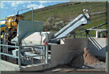
Schnelle Restbetonaufgabe Materialfallhöhe bis 3,5 m