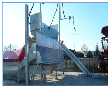
Mermans - Belgien